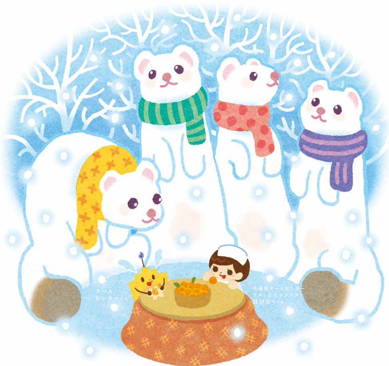
ナース センターくん