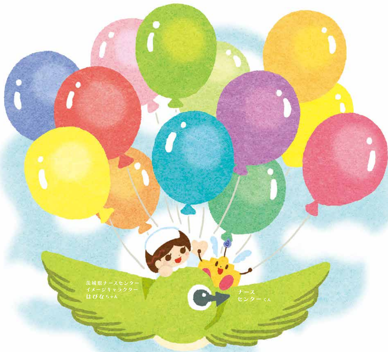
茨城県ナースセンター イメージキャラクター はびなちゃん