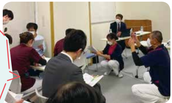
受講する大原神経科病院の皆さん

今回の「出前講座」を機に、より「院内の良好な人間関係」に繋がることを望みます。引き続き、病院・看護部の課題に対して、有効な教育計画に取り組まれることを期待するとともに、支援いたします。