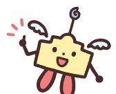
ナースセンターくん